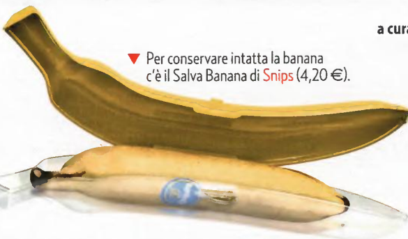
▼ Per conservare intatta la banana c'è il Salva Banana di Snips (4,20 €).

▶ Si ispira alla frutta il sale e pepe della collezione The Chin Family di Alessi (45 €).