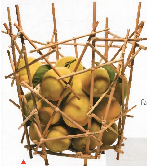
▲ Portafrutta Blow up Bamboo di Alessi (70 €).

Frullatore Artisanun con motore da 0,9 cavalli a sei velocità per frullare e omogeneizzare di KitchenAid (249 €).