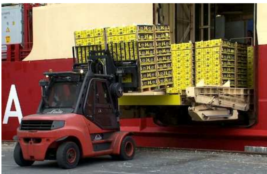
Nella foto, operazioni di scarico della frutta Orsero.