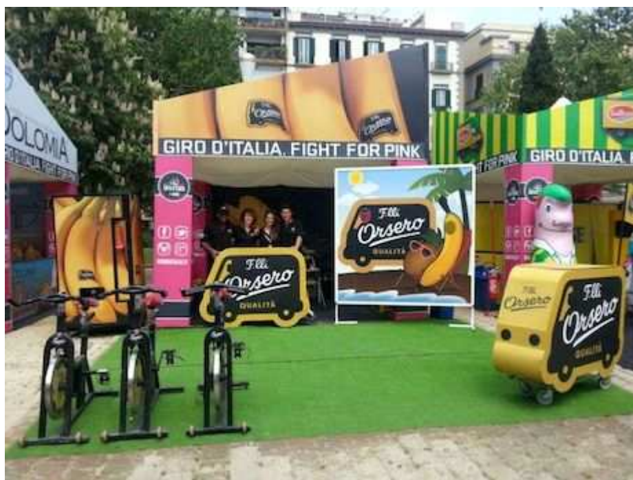
Lo stand Orsero all'Open Village del Giro d'Italia 2013.

Il camioncino F.lli Orsero è presente sulle strade del Giro con degustazioni gratuite di banane di qualità extra premium lungo ogni tappa, distribuite da pick-up con banane giganti e da vending machine umane. Nel 2012 sono state distribuite circa 175.000 banane confezionate singolarmente mentre per quest'anno se ne prevedono 200.000.